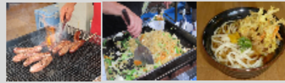
生ウインナー 富士川塩やきそば ゆずうどん

富士川町のご当地グルメ「富士川塩やきそば」や「富士川焼うどん」のほか、栗煎餅・山家焼などのお土産品、ゆずを使ったお菓子など、富士川町を満喫出来る出店が並びます!!